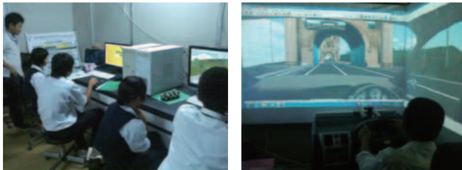
図3 SS 技術科学 実験実習講座の実施状況

説明し、通学などの生活行動と交通事故との関連性を説明した。その後、演習を開始し、各自に図1(a)のDS-6000の危険予測体験プログラムで運転や事故の体験をさせるとともに、UC-Winの基本操作を習得させた。その後、独自の交通危険体験の解析方法を適用し、交通安全を指向したまちづくりの改善計画を立案させた。各自の改善計画は2人一組でコンピュータ上のシミュレーション環境にて実現させた。最終的には、その改善効果を自身あるいは他者による運転により評価した。改善計画の立案から評価の過程は、「評価検討シート」に記述させ、また参加学生と講師間で可視化・共有しながら、改善方法の抽出と具体化を段階的に実施する手法を用いた。