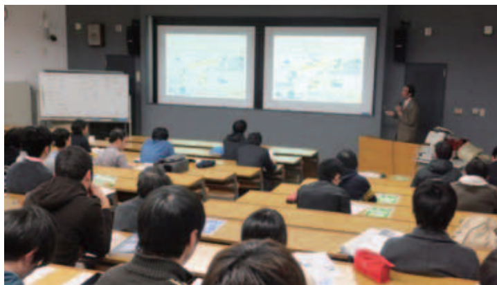
図5 あいち ITS 大学セミナー開講の様子