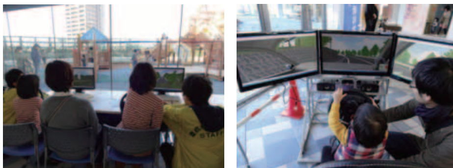
図4 こども未来館 ここにこ での出展の様子

今後、同様に交通安全に関連する施設等と連携しながら、よりよい安全啓蒙活動が実施できることを期待している。