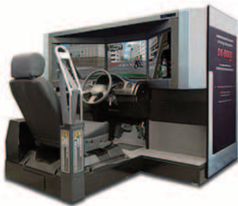
(a) 三菱プレジジョン製 DS-6000

当研究室では、2006年より各種計測技術や関連研究成果の安全運転支援応用を目的とし、関連研究における運転行動計測のプラットフォーム、および、各種計測システムの実装検証対象としてドライビングシミュレータを導入してきた。これらは、当初導入した三菱プレジジョン製 DS-6000（主に、自動車教習所などにおける危険予知訓練用）、およびフォーラムエイト製 UC-Win/Road（主に、都市計画、運転環境検証用）を利用したシミュレータシステムの合計3台である。特に、2012年度末には、図1(b)に示すように、前方・側方の合計3面のスクリーンと運転席周辺装備を含むシミュレータ装置を導入し、より臨場感の高い運転シミュレーションが実現できるようになった。これらを本学研究実験棟 D1 棟 403 号室に集約し、整備した。