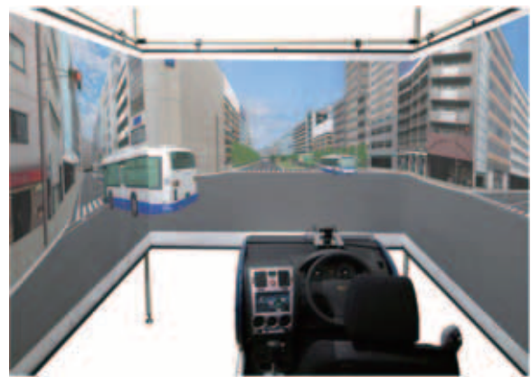
(b) フォーラムエイト製 Compact Research Simulator