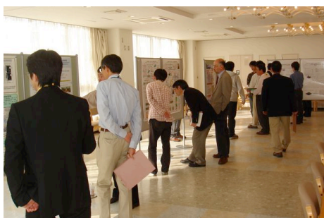
ポスターセッションの様子